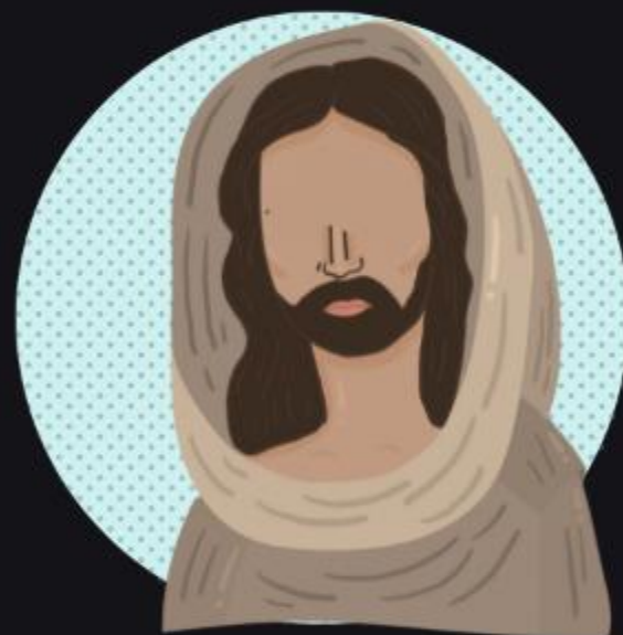
Jesus foi rejeitado por Seus amigos (Mt 26:47-50)

Cristo enfrentou mais do que somente a rejeição daqueles a quem amava. Sem o Seu sofrimento e morte, aquelas pessoas estavam caminhando para a perdição.