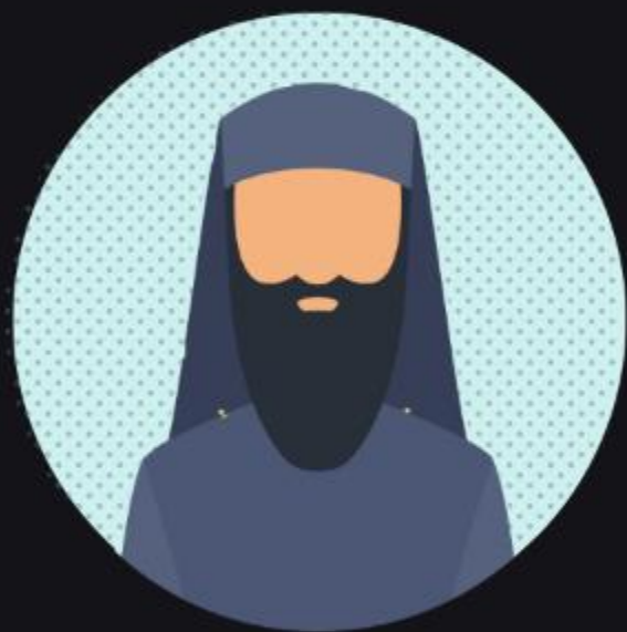
Jesus foi rejeitado pelos Seus líderes religiosos (Mt 12:22-24)

Conforme profetizado, Cristo seria rejeitado. Geralmente, olhamos para essa rejeição de uma maneira genérica, mas a Bíblia nos ajuda a ver o quão doloroso deve ter sido.