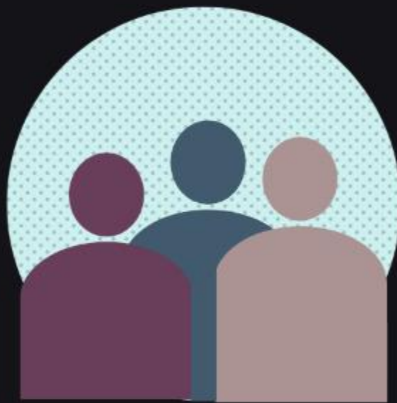
Jesus foi rejeitado por Sua comunidade (Lc 4:21-30)