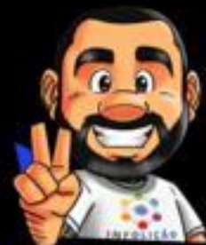
Ilustração da capa: Adinan Batista