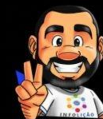
Ilustração da capa: Adinan Batista