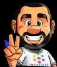
Ilustração da capa: Adinan Batista