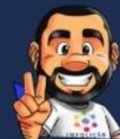
Ilustração da capa: Adinan Batista