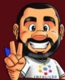
Ilustração da capa: Adinan Batista