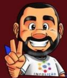
Ilustração de capa: Adinan Batista