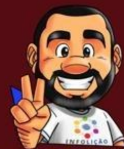
Ilustração da capa: Adinan Batista