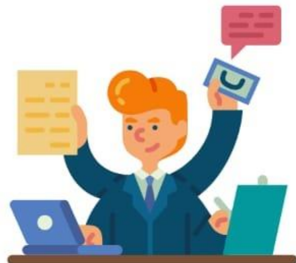
Excesso de atividades (Ec 5:3)

Quando tentamos fugir da presença de Deus ficamos inquietos. Somente ao lado dEle o ser humano tem paz e descanso.