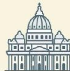
Cidade do Vaticano, Itália.

Não está limitado a uma área geográfica. Em todos os lugares e para todos os povos, o sábado se apresenta como um templo no tempo (Gn 2:1-3 e Is 58:13-14).