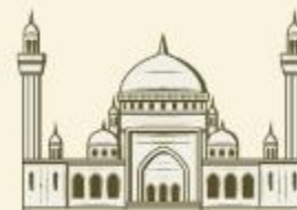
Meca, Arábia Saudita.