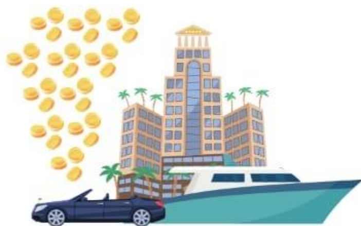
Bens materiais (Ec 5:10)

Por suas ações pecaminosas e desobediência, Caim se tornou um "fugitivo e errante pela terra" (Gn 4:12). E hoje, as pessoas tentam preencher o anseio pela graça divina através de: