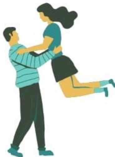
Relacionamentos (Pv 18:24)