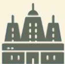
Bodh Gaya, Índia.