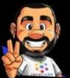
Ilustração de capa: Adinan Batista