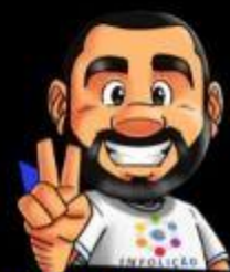
Ilustração da capa: Adinan Batista