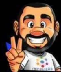
Ilustração da capa: Adinan Batista