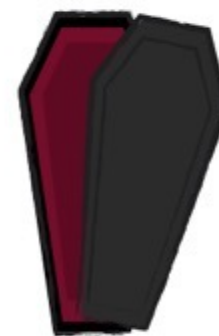
Cadáveres (Is 66:23-24; Ap 21:27)

Em geral, as predições feitas pelos profetas do Antigo Testamento originalmente se aplicavam ao Israel literal e deveriam ter-se cumprido com ele, sob a condição de que obedecessem a Deus.