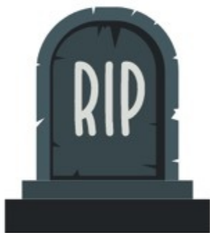
Morte (Is 65:20; Ap 21:4)

Apesar de muitas semelhanças, a descrição de Isaias de uma nova Terra não pode ser aplicada primariamente ao mundo vindouro apresentado no Novo Testamento, se fizermos isso encontraremos algumas dificuldades com a presença de: