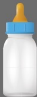
Nascimento (Is 65:23; Lc 20:35)